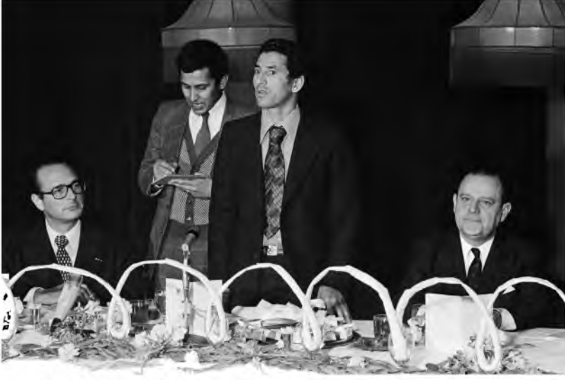
جانب من استقبال رئيس الوزراء الليبي عبد السلام جلود لرئيس الوزراء الفرنسي جاك شيراك ووزير التجارة الخارجية ريمون بار أثناء زيارتهما لطرابلس، ليبيا، .1976/3/22